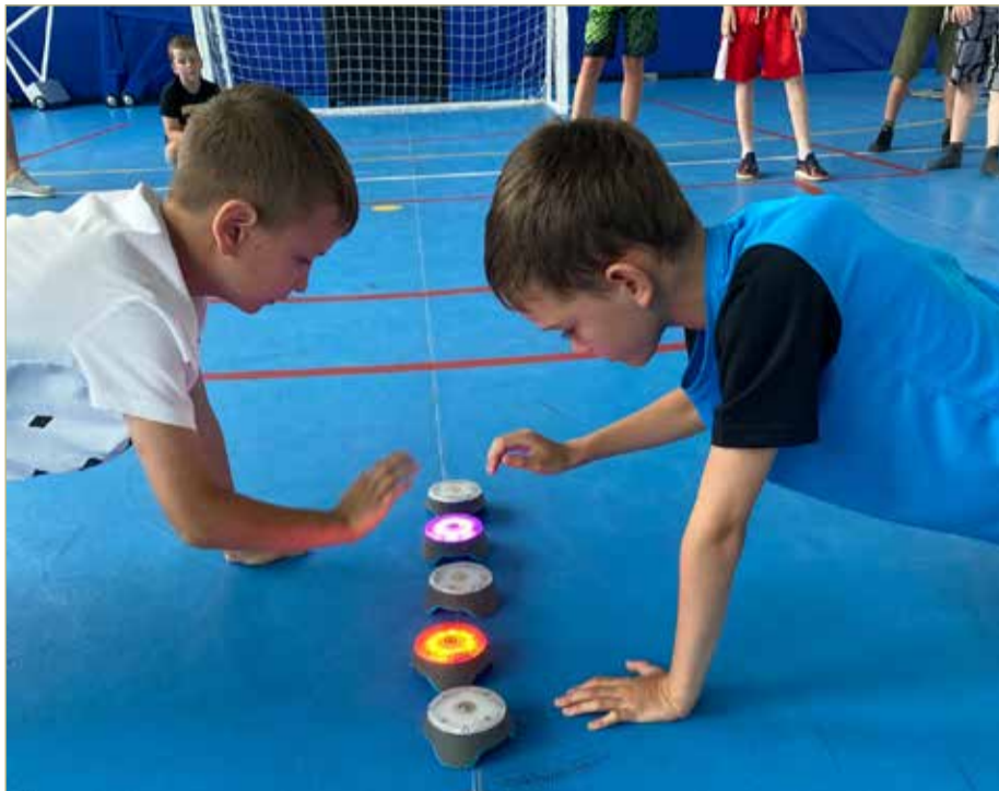
Новый тренажёр в любытинской спортшколе — это не только полезно, но ещё и весело.