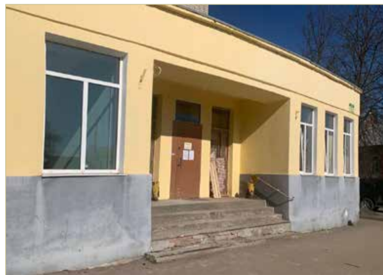
Ремонт и преобразование детской библиотеки в модельную планируют завершить к середине июля.

На сегодняшний день в старшем читальном зале стены и потолки заново оштукатурены и подготовлены под покраску. В младшем читальном зале перед ремонтом вскрывались полы, чтобы устранить причину их прогибания. Ведётся ремонт в запасниках.