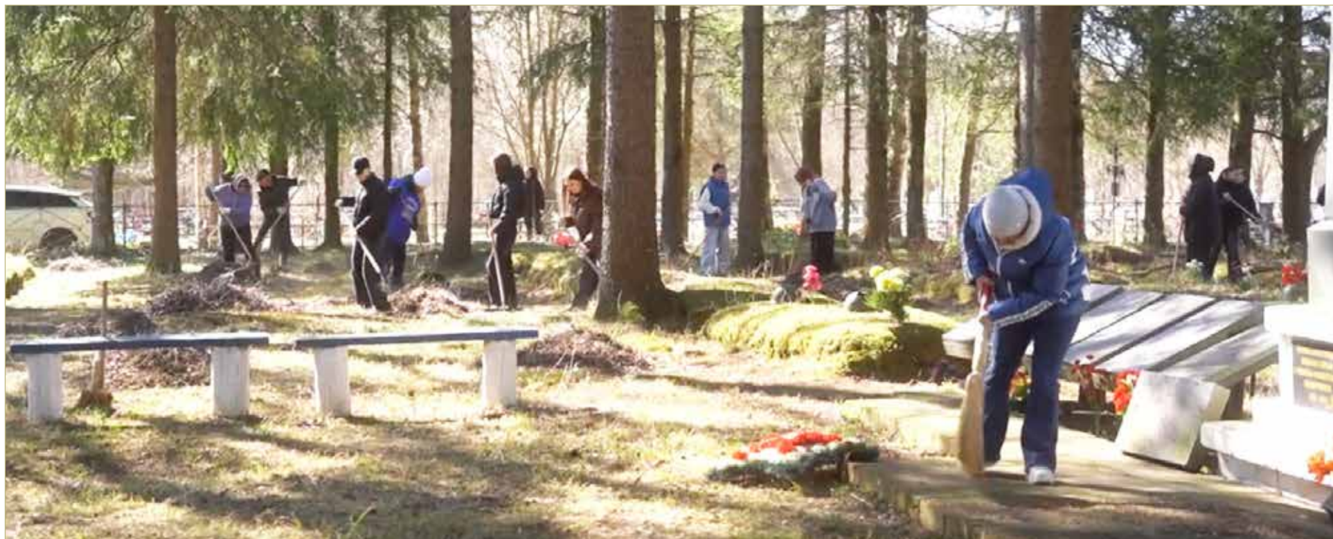
На воинском захоронении в урочище Костова прошёл субботник.