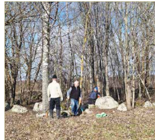
Тосовцы подготавливают археологический памятник к дальнейшему благоустройству.

— Было ещё два подобных круга: у деревни Суцёво и у села Подгощи. Один из них описал Николай Рерих. Есть теория, что это были сторожевые костровые круги, — сообщила Любовь Николаевна. — Что касается версий о предназначении сооружения, то их несколько. Известно, что внутри кургана на глубине около полутора метров залегает зольно-угольный слой, что свидетельствует о том, что некогда там горел огромный костёр. Есть версия, что так, возможно, хоронили слуг и простых людей. Их останки опускали в кувшины и закапывали, поскольку недалеко от круга расположен