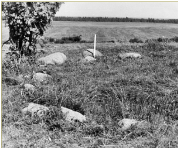
На старом фото чётко видно, что валуны Коломовского круга выложены в форме эллипса. Сейчас внутри них вырос небольшой лесок.

Призналась, что в тот момент почувствовала себя без вины виноватой, не понравилось ей высказанное замечание. Но после той встречи она начала искать информацию о Коломовском круге и думать,