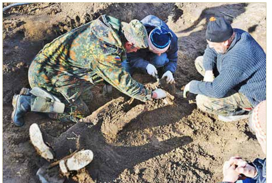
На месте расстрела командующего 34-й армией в деревне Лобаново, 2018 год. Не всегда поисковикам удаётся вот так буквально докопаться до судьбы...