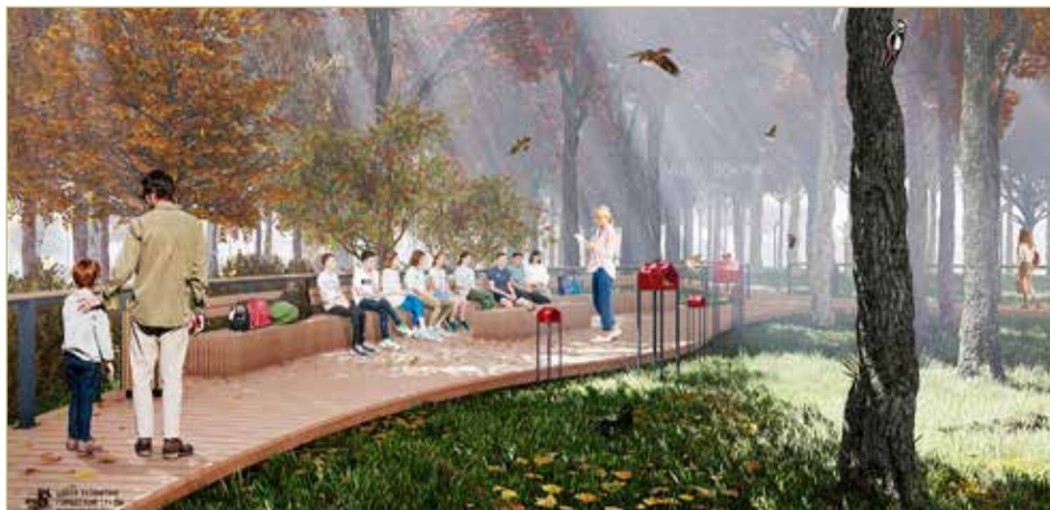
Одной из новинок в парке 1 Мая станет эконопа с деревянным настилом.

— Конкурсные процедуры проведены, контракт с подрядной организацией — новгородской компанией ООО «Максстрой 72» — муниципальное казённое учреждение «Городское хо-