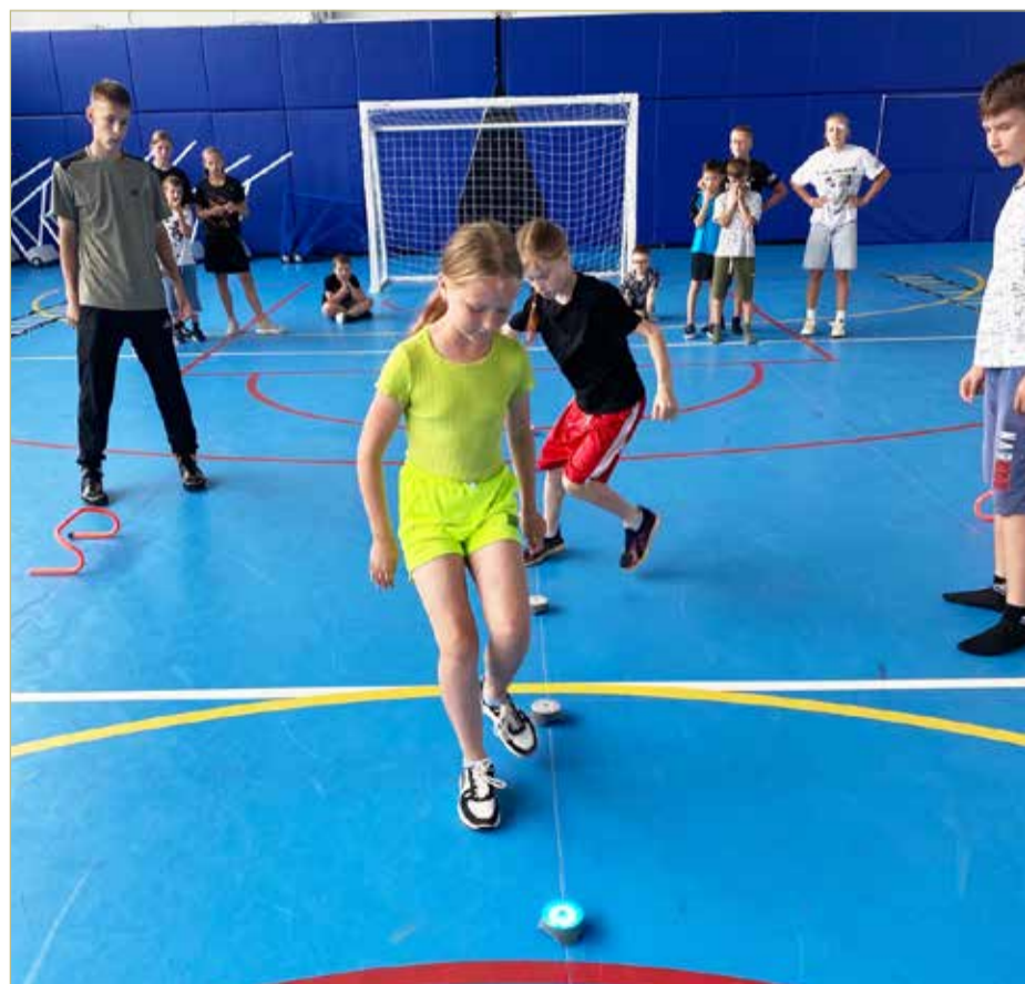
Сенсорные датчики можно использовать для сотен различных упражнений.

По сообщениям министерства спорта Новгородской области